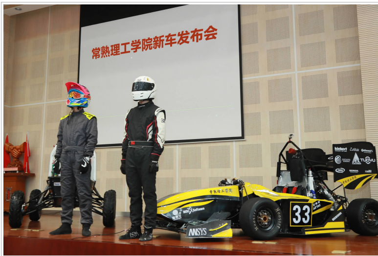
△9月19日下午,我校在东南校区举行2018年新版赛车发布会。现场发布两款新车,分别为第五代方程式赛车、第一代巴哈赛车。由此,我校拥有两支大学生车队:CIT车队、巴哈赛车队。