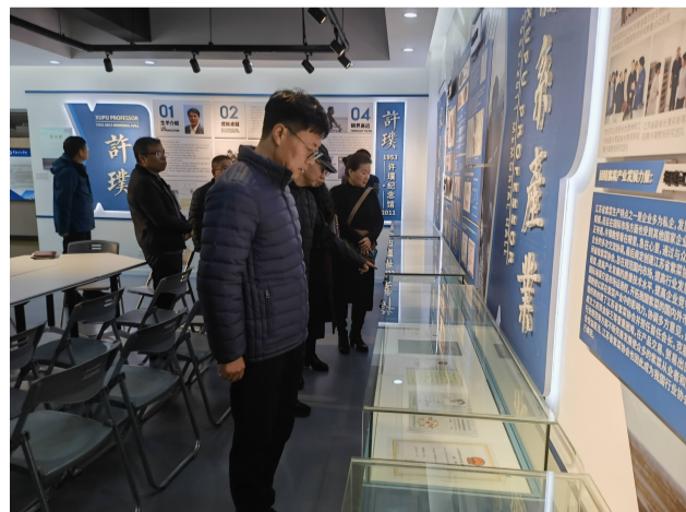
△ 图为12月4日下午,学校组织各民主党派及党外代表人士在省同心教育实践基地许璞精神教育馆开展联谊交流活动。