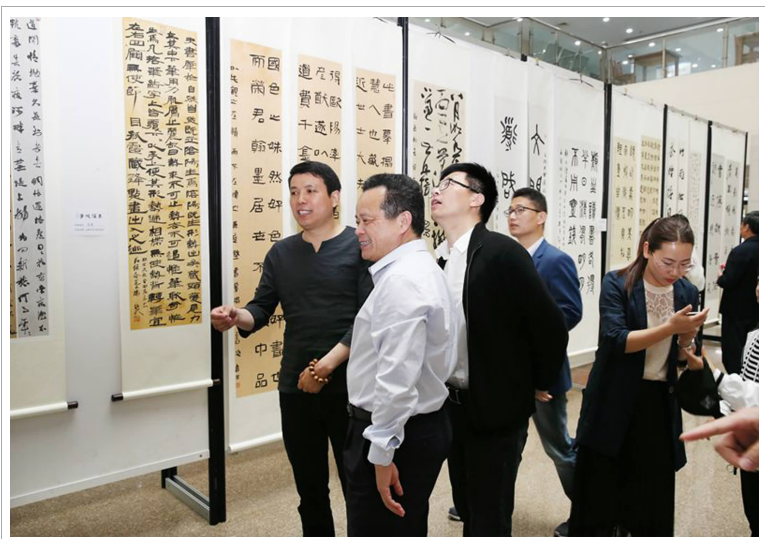
△ 4月21日下午,由校庆办、校友会和校团委联合承办的“春催桃李——常熟理工学院六十周年校庆校友优秀书法作品邀请展”在东湖校区逸夫图书馆开幕。