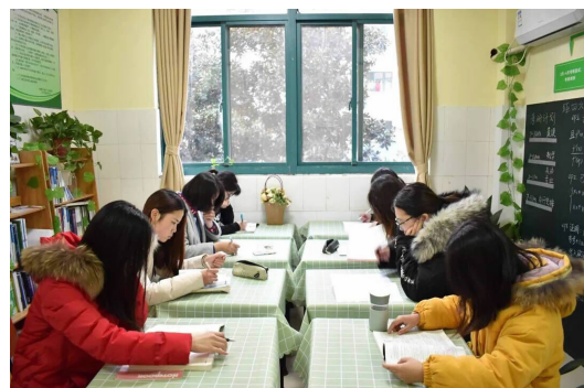
△ 物理与电子工程学院学生在考研小家学习。

考勤系统、“学长制”、“新生之友”、云班课……这些新颖的字眼都是各学院搭建的学风建设新平台。计算机科学与工程学院结合考勤实际需求,自行开发考勤