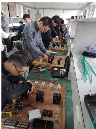
△ 电气与自动化工程学院学生在实验室切磋琢磨。

系统,该系统实现了各类角色的定义和功能分配、实现了课表的录入和修改、实现了考勤数据的录入和审核、实现了考勤数据的分类统计和分析,为学风建设和教风建设提供参考数据。人文学院自2013年开始试行“学长制”。学长制是指选派优秀的高年级学生与低年级学生结对子,解答低年级学生学习、生活等方面的问